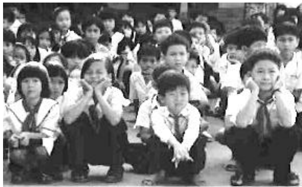
Chaque lundi matin, les écoliers se réunissent dans la cours pour le lever du drapeau. Le directeur félicite les meilleurs élèves (ici au Vietnam).

lao. Au fur et à mesure de leur avancée scolaire, de nouvelles classes seront ouvertes. Au collège, puis au lycée. Ces enfants sui-